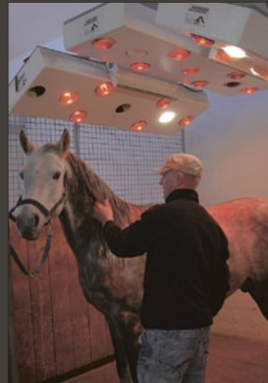
Solarium zum Trocknen des gewaschenen Fells und zur Aufwärmung der Muskeln.