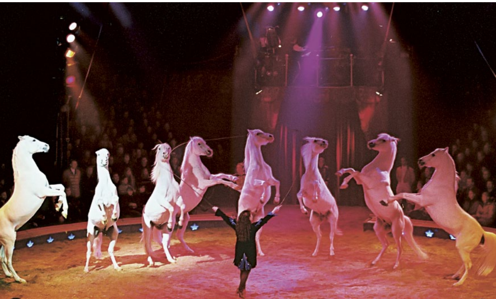
Der Umgang mit Hengsten will gelernt sein.

..... Auch Hengste sind soziale Lebewesen.