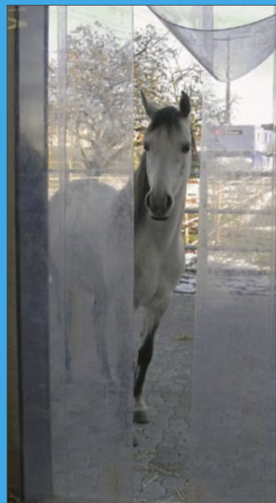
Der Winterstall in Rapperswil-Jona