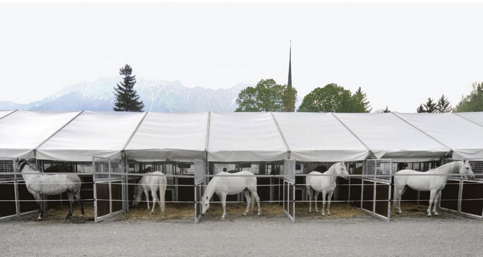
Ein Haltungssystem, das den Pferden behagt.

Pferde geniessen im Circus Knie bekanntlich einen hohen Stellenwert. Wir legen grossen Wert darauf, dass die essenziellen Bedürfnisse der Tiere – bestmögliches Stallklima, soziale Kontakte, ausgewogene Nahrung, genügend Bewegung und der fachgerechte Umgang – vollumfänglich befriedigt werden.