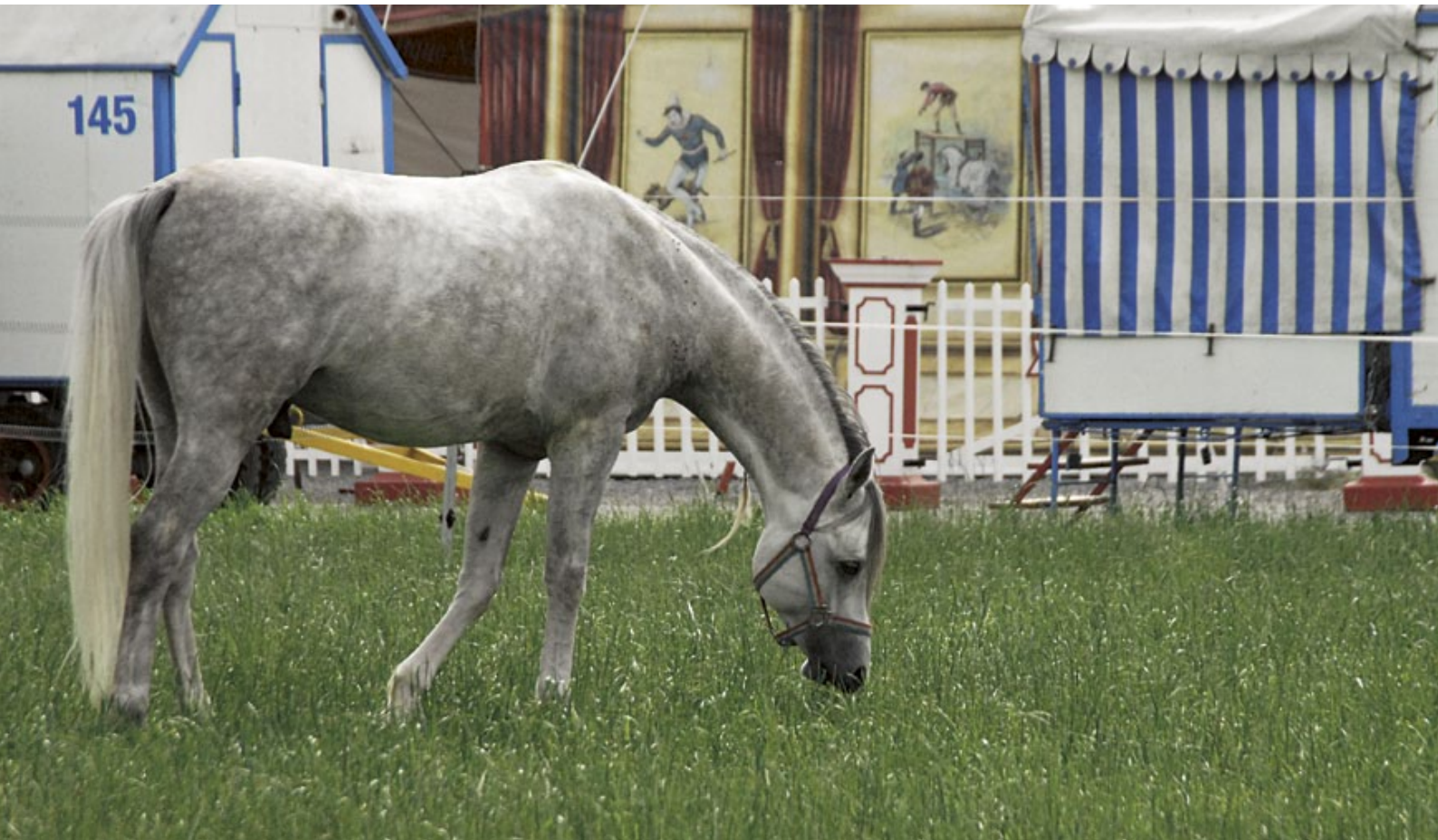
Wohlfühlen im Paddock.

Aggressives Verhalten von dominanten Pferden darf nicht dazu führen, dass bei der Fütterung auf begrenzter Fläche rangniedere Tiere benachteiligt werden.