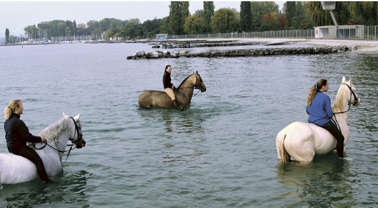
Pferde sollten mit einem breiten Spektrum an Reizen konfrontiert werden.

Alle unsere Pferde verbleiben bis an ihr Lebensende in Rapperswil-Jona. Wir trennen uns von keinem unserer Tiere.