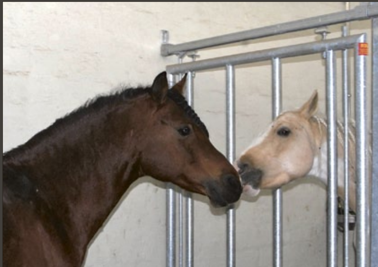
Hengste wollen wissen, wer ihr Stallnachbar ist.