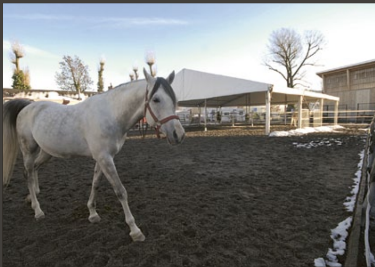
Sandpaddocks, die dem Bewegungsbedürfnis der Pferde dienen.

Die 2009 nach wohlgedachten Überlegungen umgebauten Stallräumlichkeiten in Rapperswil-Jona unterscheiden sich in Bezug auf die Unterbringung der Pferde qualitativ nicht von der praktizierten – erprobten – Haltungsform während der achtmonatigen Tournee. Helle, geräumige Innenboxen – die dem einzelnen Pferd ein Höchstmass an sozialen Kontakten ermöglichen, will heissen: so viel Körpernähe, wie adulte Hengste gegenüber gleichgeschlechtlichen Artgenossen normalerweise dulden – mit direkt angrenzendem Auslauf ins Freie tragen zum allgemeinen Wohlbefinden der Tiere bei. Zur weiteren Ausstattung des Winterquartiers am oberen Zürichsee gehören vier Paddocks, deren Bodensubstrat aus einem Sandgemisch besteht, und eine Reithalle mit integriertem Manegenrund, wo die täglichen Tierproben stattfinden.